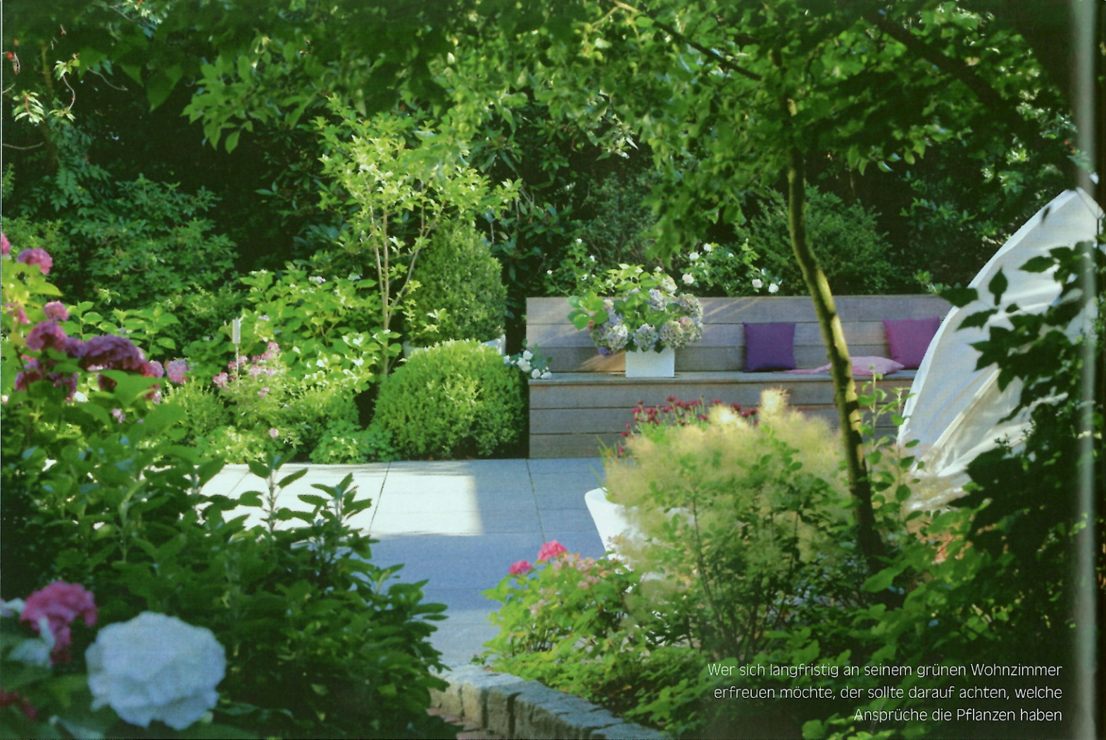
Wer sich langfristig an seinem grünen Wohnzimmer erfreuen möchte, der sollte darauf achten, welche Ansprüche die Pflanzen haben